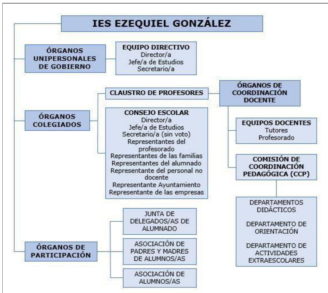
Tabla 2: Estructura organizativa.